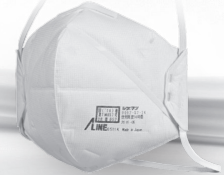
使い捨て式防じんマスク